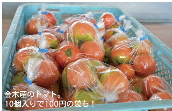
金木産のトマト。10個入りで100円の袋も!

つがるにしきた農協津軽北部統括支店跡地で営業している無人直売所では、新鮮な朝採れ野菜が多く並びます。