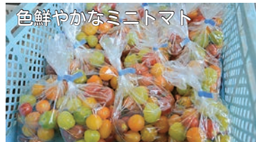
色鮮やかなミニトマト

旬の野菜はもちろん、おもちゃえご天といった加工品も取りそろえています。ぜひ訪れてみてはいかがでしょうか？