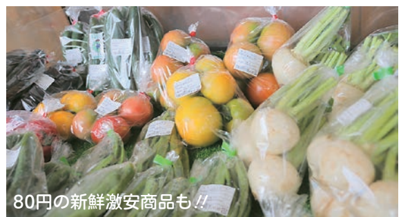
80円の新鮮激安商品も!!

豊富すぎる故に超お買い得の「100円未満」の商品まで並んでおり、知る人ぞ知るお得な直売所です。また、200円未満で不定期に行われる「野菜詰め放題」も大人気のイベントです。もちろん「市浦牛」も販売していますので、野菜で得した分、おいしい市浦牛はいかがでしょう!?