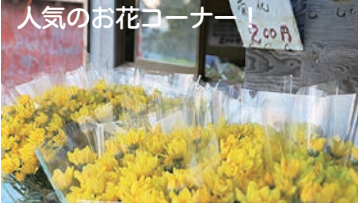
人気のお花コーナー

営業時間…6:00~18:00 6月第3日曜~11月中旬 住 所…飯詰字桜田14-4 電 話…37-2044