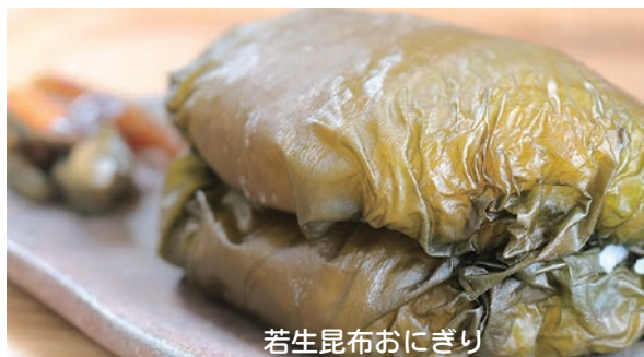
若生昆布おにぎり

津軽郷土料理の「若生昆布おにぎり」は食べやすさを追求し、優しく二段に包み込んでおり、一度味わってしまうと「もう海苔おにぎりには戻れない…」などとりこになってしまうお客さんが続出中です。また、石炭をモチーフにした看板商品「石炭クッキー」に加え、りんご塩の【しょっぱさ】、バタークリームの【甘さ】、ブラックココアパウダーの【苦味】で三味一体スイーツ「中まで赤いりんごのバタークリームサンド(仮称)」を試作中ですので、請うご期待!!