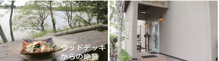
ウッドデッキからの絶景

「地元素材を使った料理はもちろんですが、何時間も滞在できるアットホームな空間を体感して欲しいです」と店主は語ります。