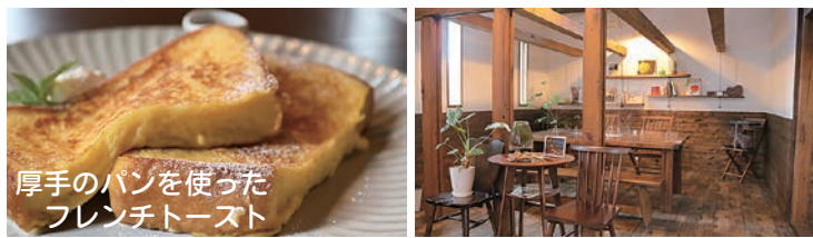
厚手のパンを使ったフレンチトースト

営業時間…10:00~17:00 (定休日 月曜日) 住 所…金木町朝日山399-1 電話番号…080-1666-6328