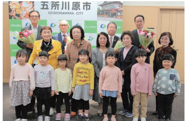
市長たちに花束を手渡した連合婦人会の皆さんと園児の皆さん