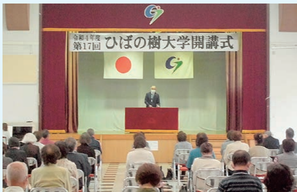
『ひばの樹大学開講式』の様子

市民活動や伝統芸能を継承する活動を支援し、再び活力を取り戻すことを後押しするため、市ではこのほど各団体の事業経費の一部を補助する応援事業を実施します。地域振興に資する活動の推進や各地域の伝統芸能を後世に継承するため、行政としてしっかりと応援したいと思っています(3、4ページ掲載)。