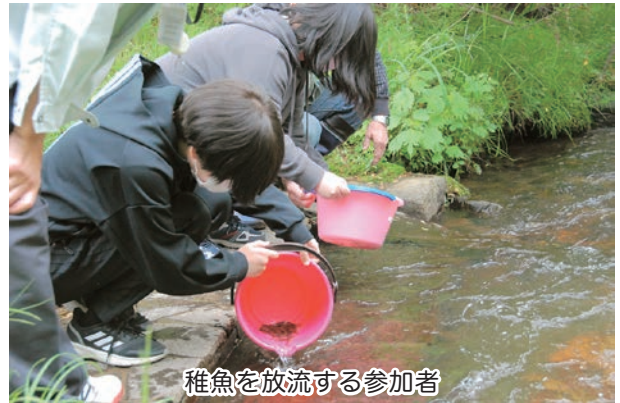
稚魚を放流する参加者