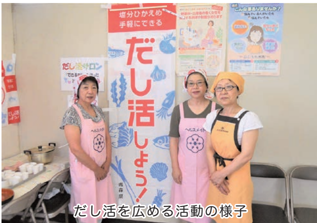
だし活を広める活動の様子

主に、「おやこの食育教室」や「お正月料理」などのテーマに沿った調理実習、市の栄養教室の試食づくりやレシピ考案などのお手伝い、「だし活」を広める活動などを行っています。