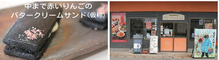
中まで赤いりんごのバタークリームサンド(仮称)

津軽郷土料理の「若生昆布おにぎり」は食べやすさを追求し、優しく二段に包み込んでおり、一度味わってしまうと「もう海苔おにぎりには戻れない…」などとりこになってしまうお客さんが続出中です。また、石炭をモチーフにした看板商品「石炭クッキー」に加え、りんご塩の【しょっぱさ】、バタークリームの【甘さ】、ブラックココアパウダーの【苦味】で三味一体スイーツ「中まで赤いりんごのバタークリームサンド(仮称)」を試作中ですので、請うご期待!!