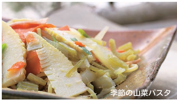
季節の山菜パスタ

店内はゆっくりとした時間が流れ、忙しい日常を忘れさせてくれます。また、ウッドデッキで森林浴をしながら、 梵珠山から採れた山菜 をたくさん使った「季節の山菜パスタ」を味わうことは、これ以上ないぜいたくです。