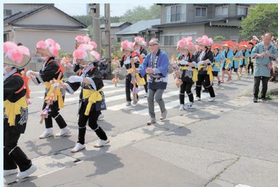
市浦地区『相内の虫送り』の様子