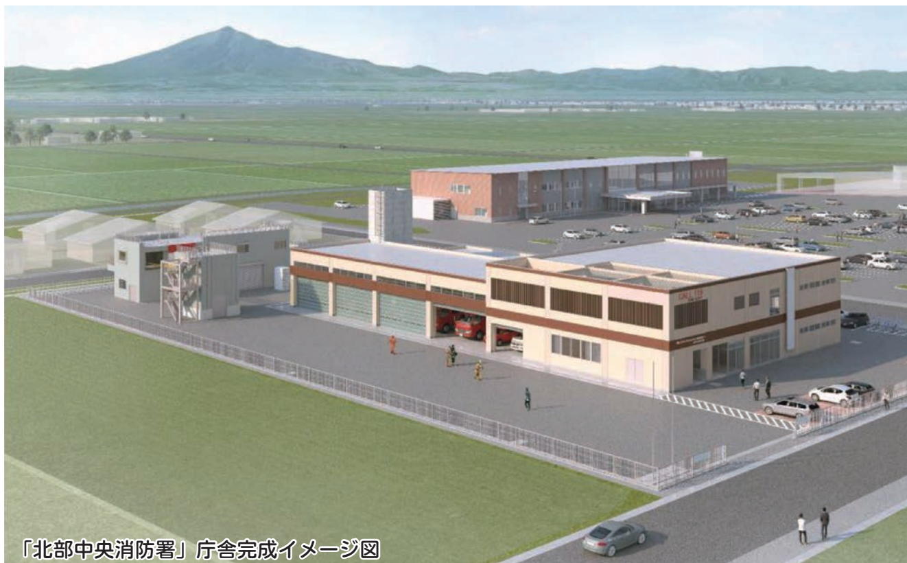
「北部中央消防署」庁舎完成イメージ図

現在、令和4年4月からの供用開始に向けて、中泊町役場付近に建設中の(仮称)統合消防署の名称を「北部中央消防署」に決定しました。