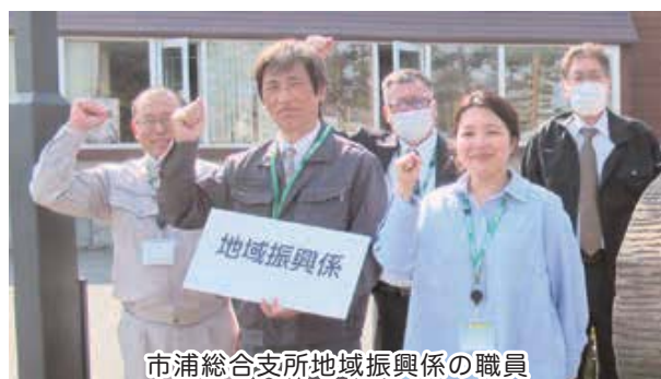
市浦総合支所地域振興係の職員

問い合わせ先…金木総合支所地域振興係 内線3203 / 市浦総合支所地域振興係 内線4015