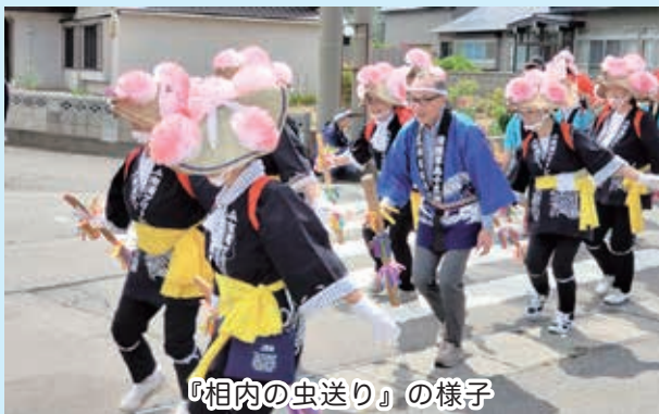
『相内の虫送り』の様子