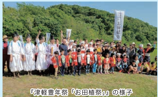
『津軽豊年祭「お田植祭」』の様子