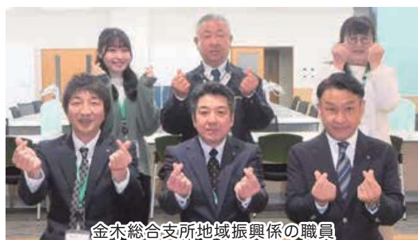
金木総合支所地域振興係の職員