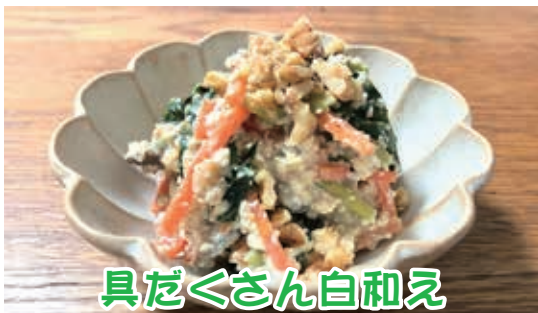
具たくさん白和え