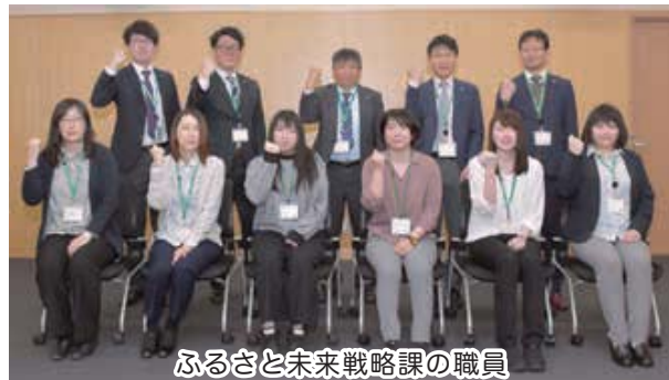
ふるさと未来戦略課の職員