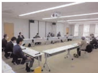
五所川原圏域定住自立圏共生ビジョン懇談会の様子(右写真)

このほど、各分野における有識者等による懇談会を経て、令和3年度から令和7年度までの5年間の取組方針を示す「第2次五所川原圏域定住自立圏共生ビジョン」を策定しました。