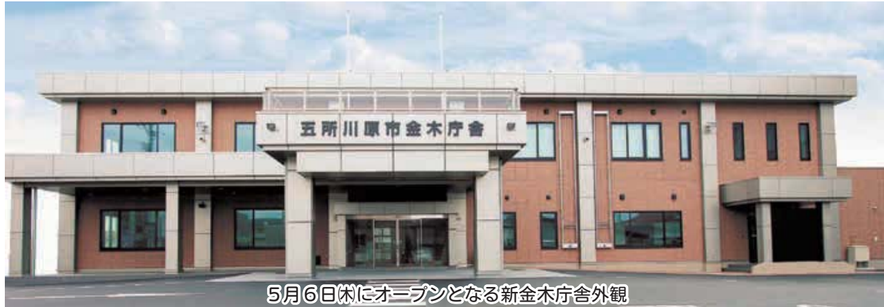
5月6日(木)にオープンとなる新金木庁舎外観

時間…8:15～ 場所…新金木庁舎正面玄関前(金木町朝日山319番地1) *現金木庁舎敷地内