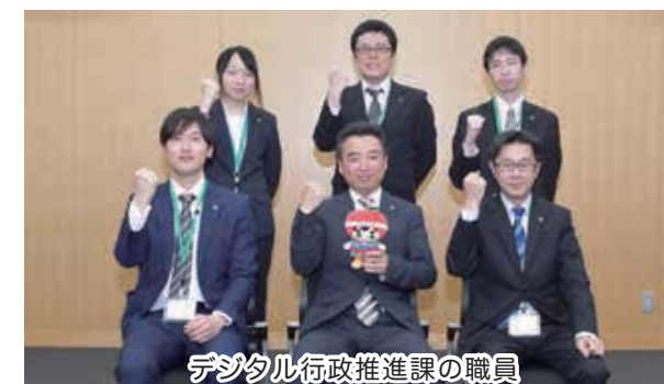
デジタル行政推進課の職員

デジタル行政推進課は、市役所内の情報システムやネットワーク情報基盤を適正に管理するほか、「ICT(情報通信技術)の浸透が、人々の生活をあらゆる面でより良い方向に変化させる」デジタル・トランスフォーメーション(DX)の考えに基づいて、ICTを活用した「人に優しい行政のデジタル化」を進めていきます。