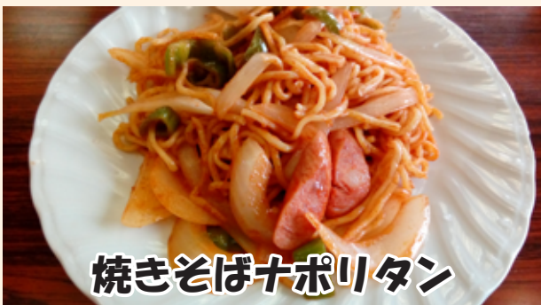
焼きそばナポリタン