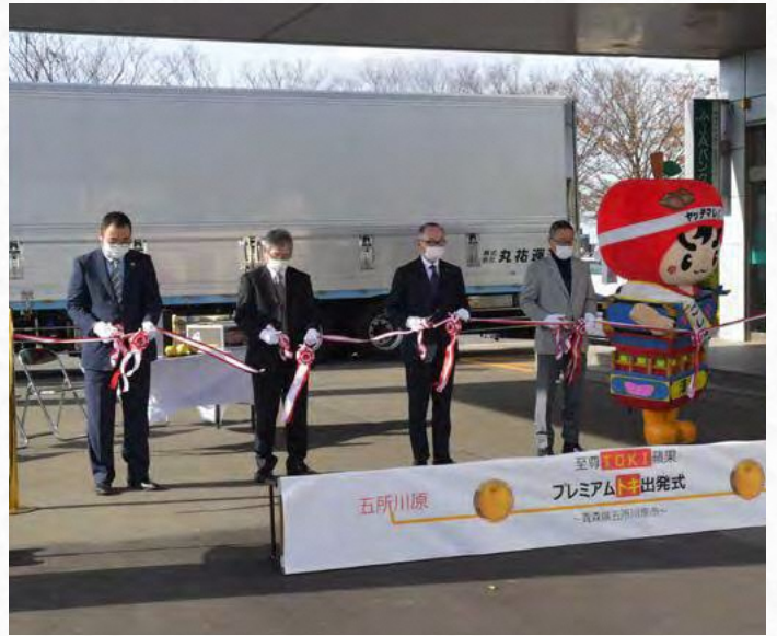
プレミアムトキ出発式の様子

11月26日から台北市内の百貨店で販売され、1玉当たりの価格は、両りんごとも化粧箱入りで、「トキ」は150元(日本円で約600円)、「レッド キュー」は120元(日本円で約480円)を予定しています。また「プレミアムトキ」の化粧箱は、当市立佐武多製作者がデザインしたものを基に作成されました。