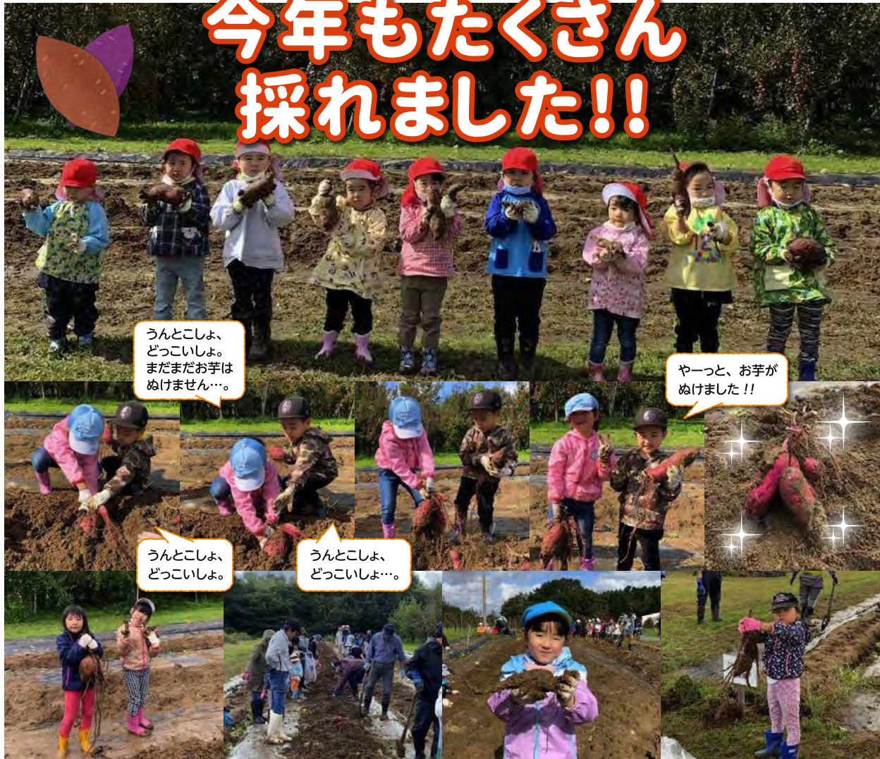
うんとこしょ、 どっこいしょ。 まだまだお芋は ぬげません…。