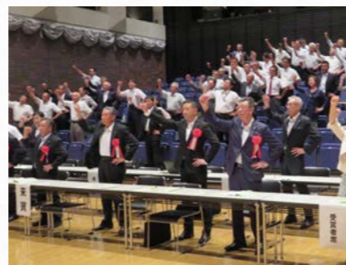
決議事項実現に向け カンパロー三唱をする参加者