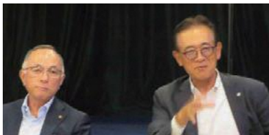
佐々木市長と一戸副市長