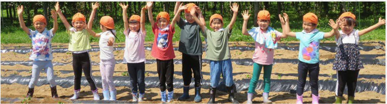
サツマイモの苗を定植し終えたみどりの風子ども園かなぎの園児たち

6月26日、市内のみどりの風子ども園ひろた・かなぎの園児たちが農業委員、農地利用最適化推進委員、VICウーマンの方々と共に市農業センター敷地内の畑で、さつま芋の苗の定植体験を行いました。 この事業は、子どもたちに農業に興味を持ってもらうのと、毎年実施しているもので、今年で二十一年目を迎えます。当日は、総勢70名ほどが定植作業に参加しました。 例年定植している苗の品種は「紅あずま」ですが、近年のさつま芋ブームにより、「紅はるか」40本、「シルクスイート」40本も試作として植えられました。 作業を終えた子どもたちは、定植した苗に向かって「大きくなーれ！美味しいお芋になーれ！」と、元気にかけ声を掛けていました。 10月には、各子ども園・団体と農業委員・農地利用最適化推進委員で収穫体験を予定しています。