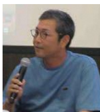
要望を語る農業者