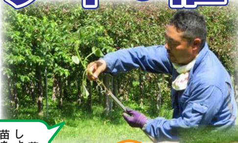
(左) 苗の定植について説明をする(株)アグリコミュニケーションズ津軽の宮田代表取締役