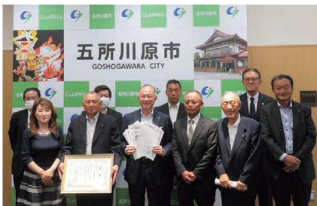
市長に受賞報告をしに来庁した農業委員たち