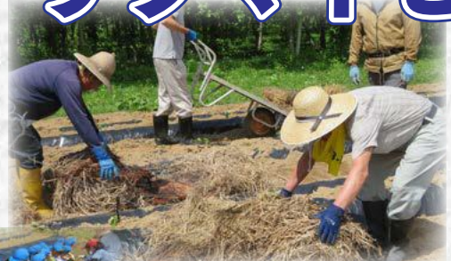
(上) 畝の間に市で収集した稲わらを敷く農業委員、農地利用最適化推進委員

葉っぱを太陽の方に向けて植えましょう。土の中に穴が空いているので、苗を深く入れてあげ、土のお布団をかけてあげましょう。