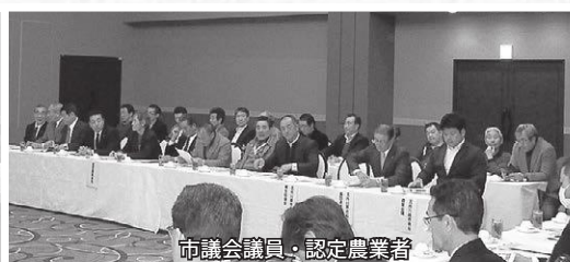
市議会議員・認定農業者