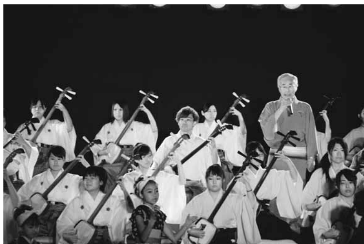
金木地域 津軽三味線（仁太坊祭り）