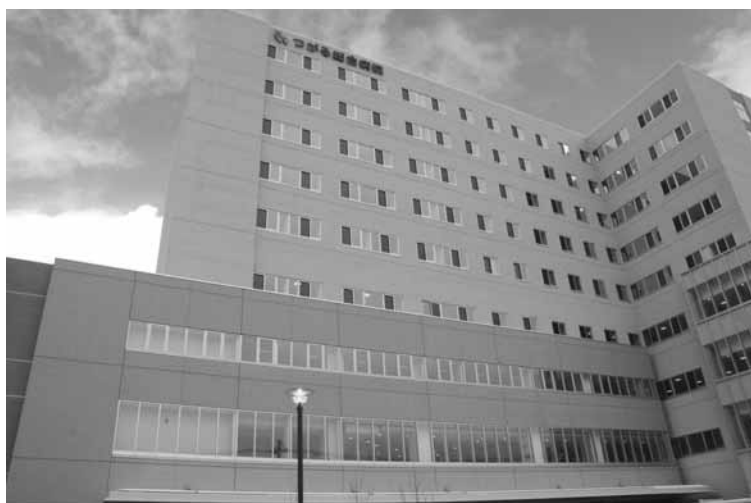
五所川原地域 つがる総合病院