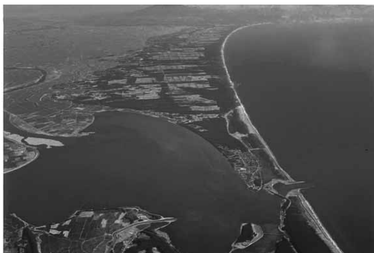
市浦地域 空から見た十三湊遺跡