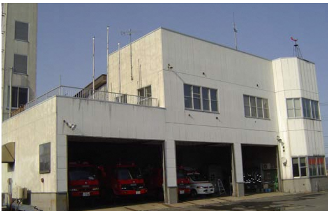
統合予定の現金木消防署庁舎

答 財政基盤の確立を優先し、子育て支援策の充実として学校給食費の無償化については、4月からの値上げ分と10月からの値上げ後の給食費の保護者負担の4分の1を市が負担することで、学校給食の完全無償化に向けた第一歩とすることとしている。今後さらなる子育て支援施策の充実に向け、検討を重ねていく。