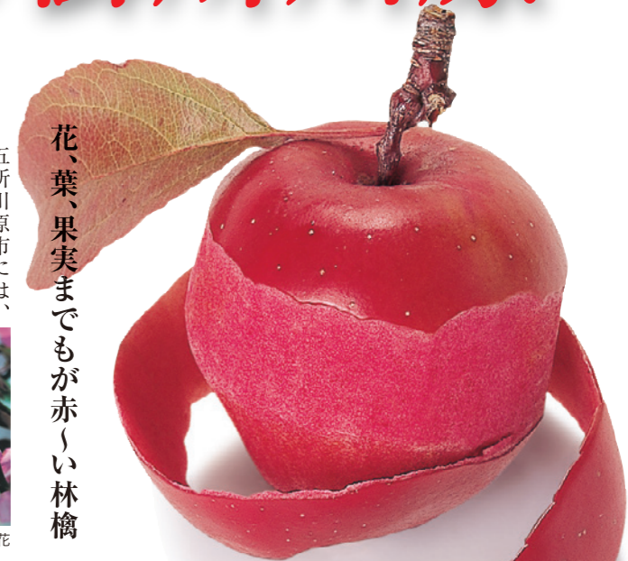
花、葉、果実までもが赤い林檎