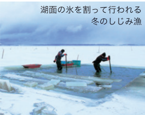
湖面の水を割って行われる冬のしじみ漁

生産量全国トップクラス 十三湖の「ヤマトシジミ」 津軽国定公園である十三湖は、青森県で3番目に大きな湖。汽水湖ゆえの生物も多く、しじみはその最たるもの。しじみの遊漁場もあり、解禁期間は多くの家族連れで賑わいます。湖畔は水を浄化する作用のある葦が生い茂り、幻の鳥といわれるオオセッカや天然記念物であるオオワシなどの野鳥も多く見られます。また、絶好の釣りポイントでもあり、ボラやウグイ・ワカサギ・ヒラメ・ハゼなどが生息し、大空望の憩いの場となっています。 特産のヤマトシジミは全国有数の生産量を誇ります。しじみは夏の土用しじみが旬といわれますが、十三湖が結水する厳寒期のしじみも美味。寒しじみと呼ばれ、夏に比べると身は若干小さ