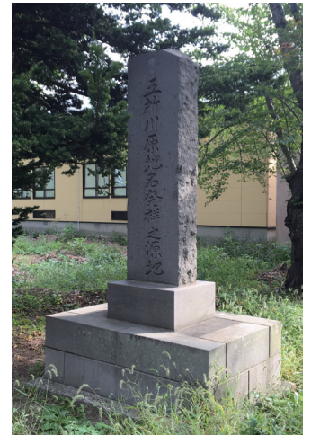
五所川原地名発祥之源地 (五所川原八幡宮)

※12時30分頃に到着予定(約6km)。天候不順により、 コース変更の場合もあります。