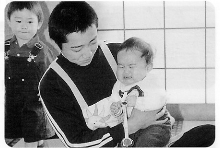
▲泣かれてドギマギ