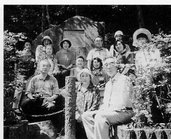
▲「御坂峠文学碑前」にて (平成9年)

太宰は芸術における白菊一輪の効果を実によく知つており、それが太宰に完璧な短編小説を書かせる所以であつたと思われる。ここでは、太宰の全存在をコップに入れたカーネーション