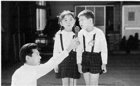
▲ぼくたちわたしたちは、交通安全を守ります