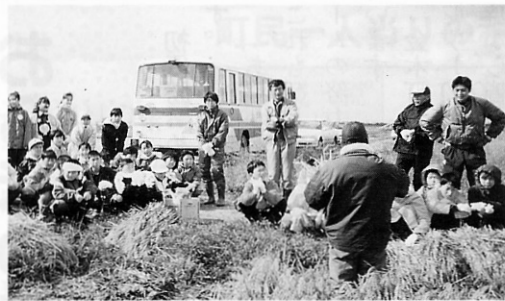
▲早く おもちが 食べたい？