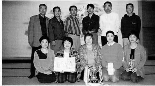
▲朝日クラブBチームの皆さん

前回までの優勝チームは、第一回大会から三連覇優勝という金字塔をうちたてた県信用クラブや去年初優勝の女性ばかりのチーム、聖母(マドンナ)と若いチームの活躍が目についたと思います。そこへきて今年の大会を制したの