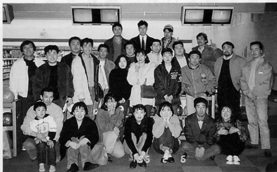
自分達が楽しいと思うことをしようがモットー

自分達の町で自分達が楽しいと思う事をしよう…… という思いで私たちは昨年「金木町青年活性化委員会」を発足。「あらゆる活性化活動を展開し、より多くの青年が町に定住することを願い、町の発展のために寄与する」と集まったメンバーは、職種、男女も年齢も様々。