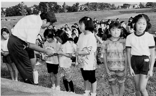
10位まで入賞者には、メダルが手渡された