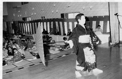
食い入るように見つめて

芸能を楽しんでいただく「い」とあいさつ。 この後、招待された二百人は、町連合婦人会や町日赤奉仕団の協力を得て一つ一つ丁寧に手作業で作られた温かい「ふれあい弁当」に舌鼓を打ちながら、金踊会や桜の会による六曲のカラオケ、十七曲の踊り等二十七曲を堪能しました。