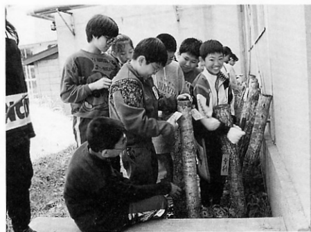
シイタケがいつぱいつくといいな

昨年は、北地方農林事務所の指導の下行われた「シイタケ栽培体験学習」で、一度の植菌でシイタケが五、六年実を付けるそうで、今年は、二日前から水に浸す、ホダ木上げの作業を先生と児童だけで行いました。ホダ木上げを終えたシイタケの木には各自の児童の名前を付けました。去年より大きく実ったシイタケが期待出来そうです。