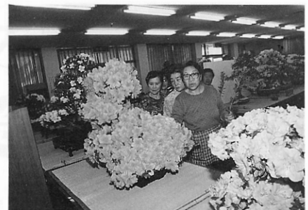
▲美しいさつきにうっとり