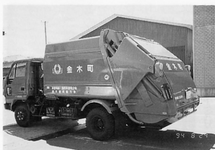
▲買い換えた塵芥収集車

これまで町の塵芥収集車は三台ありましたが、収集する一台が古くなり業務に支障が出てきましたので、全額「厚生年金・国民年金積立金」から融資を受け約七百二十万円で買い換えました。 この新しい塵芥収集車を大切に使うためにも、家庭ゴミの分別にご協力お願いいたします。