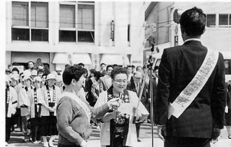
▲交通安全全町民総決起大会

この他にも、交通安全の期間中、金木中学校生徒の安全委員十六人が朝早く、みちのく銀行金木支店前、金中前、金中附近の踏み切り等三箇所