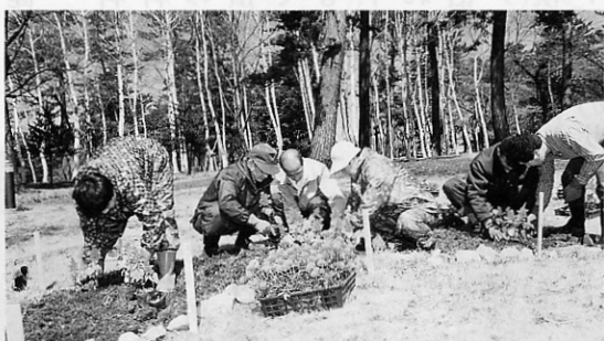
▲花時計の周りを飾りました