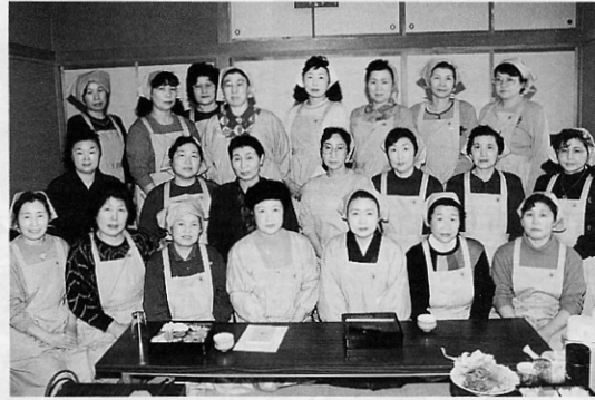
▲食生活改善推進員の皆さん

この他にも活動の一環として、保健センターで行われる「胃、大腸癌検診」の際、年一回「ヘルシー朝食」のサーブスを今年も、金木、嘉瀬、喜良市の三箇所で行います。