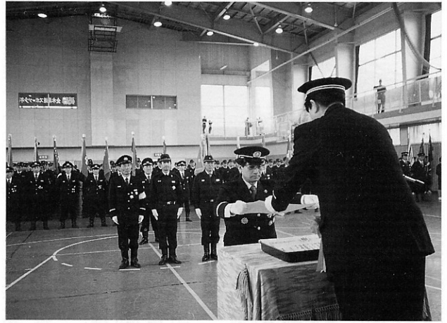
▲消防団員が勢揃いの中表彰式