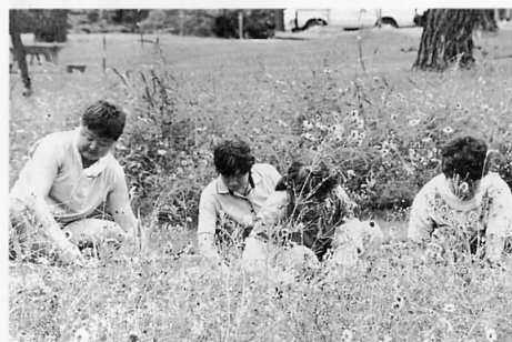
一生懸命草取りをする会員

このほど手をつなぐ親の会が会員の親睦を図ると共に、日頃お世話になっている地域のために何らかの貢献をしようと、芦野公園内ふれあい広