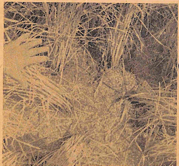
さんには天災とはいえず誠に気の毒である。