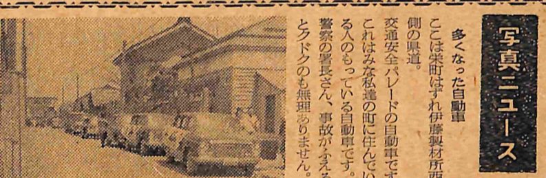
写真ニユース 多くなった自動車 写真は伊藤製材所西側の県道。

金木病院 結核病棟を増改築 二百80万円で十一月末完成 公立金木病院では、総工費七千五百万円をかけ、まる三年がかりで造られた平屋建てで、病室十一室のほか、看護婦詰所、配膳室、消毒室、浴室、洗滌室、便所、洗面所などが増改築され、新築した病室にマッチしたものである。職員はもちろんだが、患者の皆さんも、一日も早く完成されるよう首を長くして待っている。 【写真】増改築する金木病院結核病棟