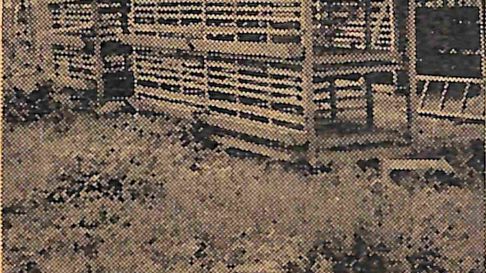
【写真】越多用鶏舎の見本

新の科学にもとづいて、高度の技... 術を導入し、生産費を引き下げる... ことが可能である。