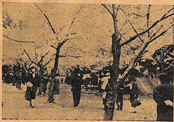
公園野芦賑う出て人 (登仙岬の桜のトンネル)

金木町保育所母の会では任期満了による役員の変更を去る通常総会を十六日に金木町保育所で開催した。