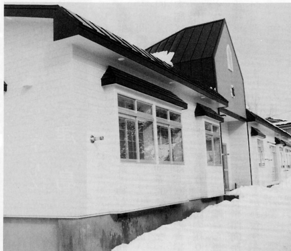
▲黄色の外壁がまぶしい友愛館

このため学校側では、教育関係施設であるために使用等についての制限は多少あるものの、使用していない期間に限り会館を地域住民の方にも解放するとしており服部校長は、「子ども会などの合宿にでも大いに利