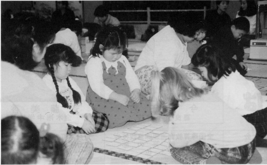
▶じっくり見据えて