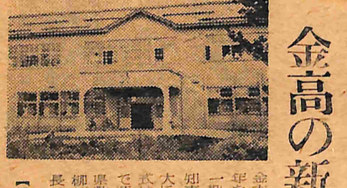
金高の新校舎でできる

町では近く町税の滞納整理に乗り出す。地方財政の窮乏は全国的な傾向であるが、当町は合併当時既に二千万円の町税の滞納があり、県地方でも去る六月に三百間にわたって町税の滞納整理を行った。結果「新金木町は町税の滞納が多い」との烙印を食っている。