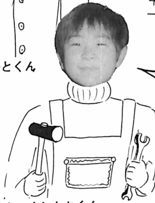
せお よしたかくん

「電気技術関係の 発光明かりになりたい （電文や機械もいじる のが好きだから）」