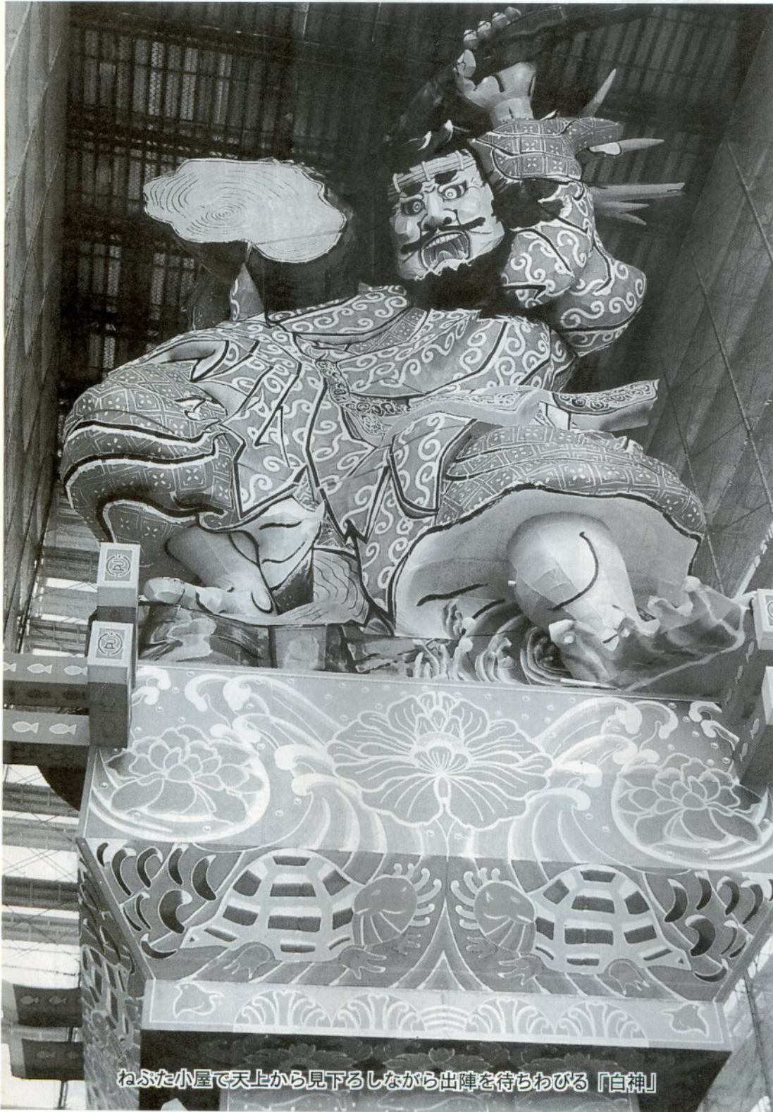
ねぶた小屋で天上から見下るしながら出陣を待ちわびる「白神」

6月30日現在 ( )内は前回は、男23,856(-2) 女26,611(-6) 計50,467(-8) 世帯18,624(+7)