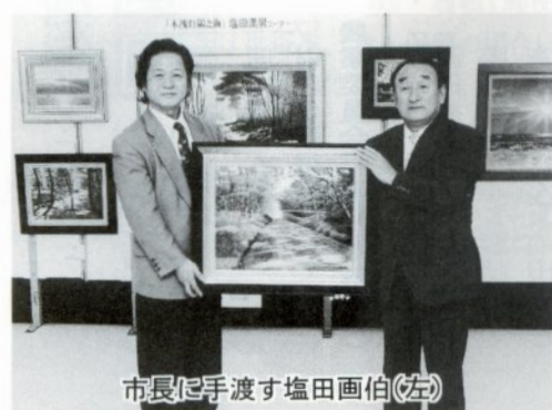
市長に手渡す塩田画伯(左)