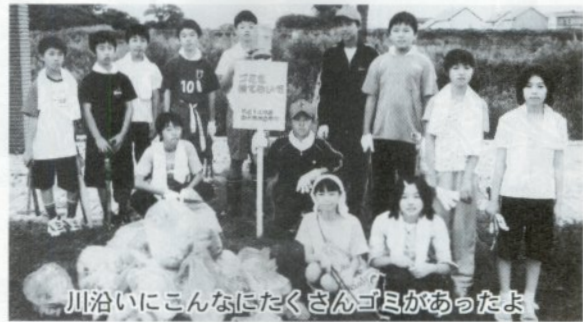
川沿いにこんなにたくさんゴミがあったよ