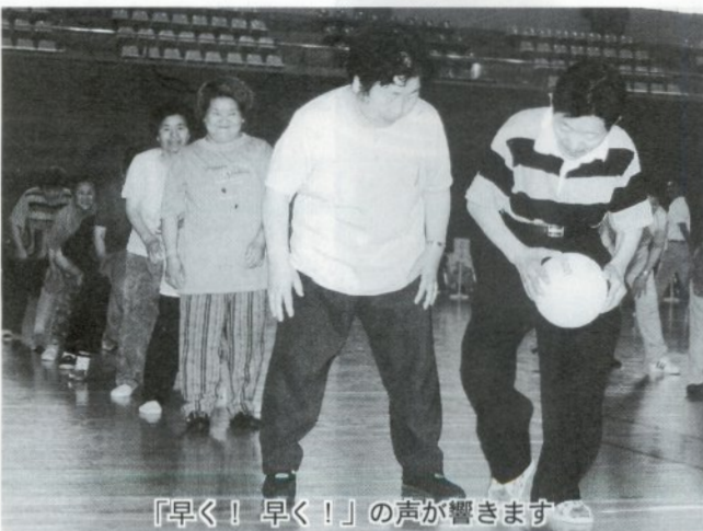
「早く! 早く!」の音が響きます

七月十七日、スポーツを通じて身体障害者の交流と健康増進をはかることを目的に、第三十六回五所川原市身体障害者スポーツ大会が市民体育館で開催され、参加した障害者約七十人と付添人など約三十人が爽やかな汗を流しました。