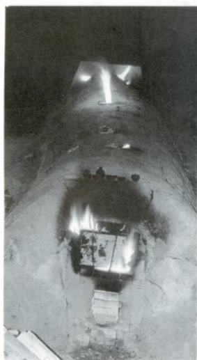
〈薪窯〉 薪を燃料とする陶磁器を焼く窯のこと。

主な催事として、「津軽半島観光物産展」では、東郡5町村と西北五14市町村の物産を一堂に集めながら、津軽半島地域の歴史・文化・自然・観光の紹介ボード、郷