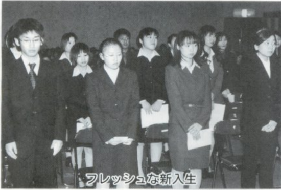
フレッシュな新入生

同学院は、日中は準看護師として医療機関で働き、夜間に看護の知識や技術を学ぶ三年生の学校として一九六六年に開校しました。以来、八百十二名が巣立ちそれぞれ各医療機関で働いています。