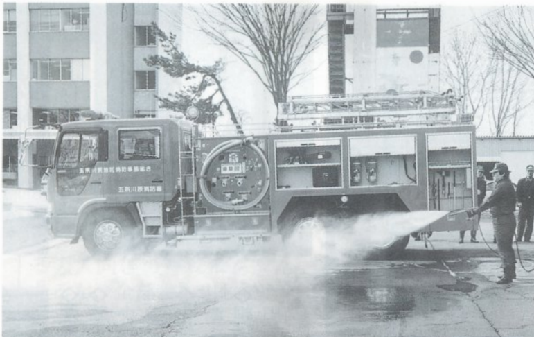
自動揚水システムによりホースの本数に応じて自動的に圧力を調整する機能や赤外線カメラが搭載され、濃煙の中でも人体を感知、火点の特定にも威力を発揮します。

ルの水槽タンクを装備し、最新式 のオートハイドレックス(水と消 火剤を混合して高圧噴霧で消火) により少ない水で早く消火でき、 車火災や油火災の初期消火と人命 救助に威力を発揮するものと期待 されています。