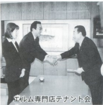
エルム専門店テナント会