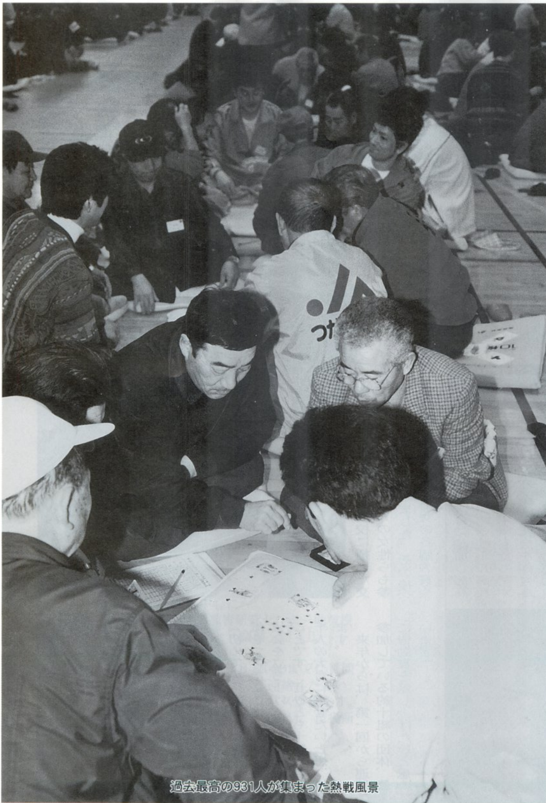
過去最高の931人が集まった熱戦風景

12月31日現在 ( )内は前回比、男23,988 (-13) 女26,683 (+19) 計50,671 (+6) 世帯18,565 (+7)