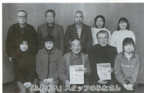
「ふれあい」スタッフのみなさん

小山会長は、「大変うれい。今後は、高齢者を対象にした事業を関係機関と連携をとりながらやりたいですね」と抱負を述べていました。