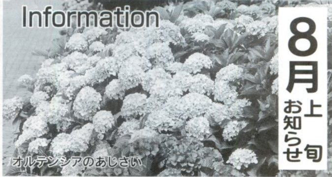
オルデンシアのおしさい