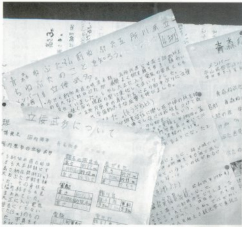
▲子どもたちは様々な角度から調べました

当時の五年生は、立佞武多作りを目標に青森ねぶた、弘前ねぶた、五所川原立佞武多の違いを調べ、夏休みの自由研究で調べたことを発表、模造紙にまとめました。そして、十月に立佞武多製作者