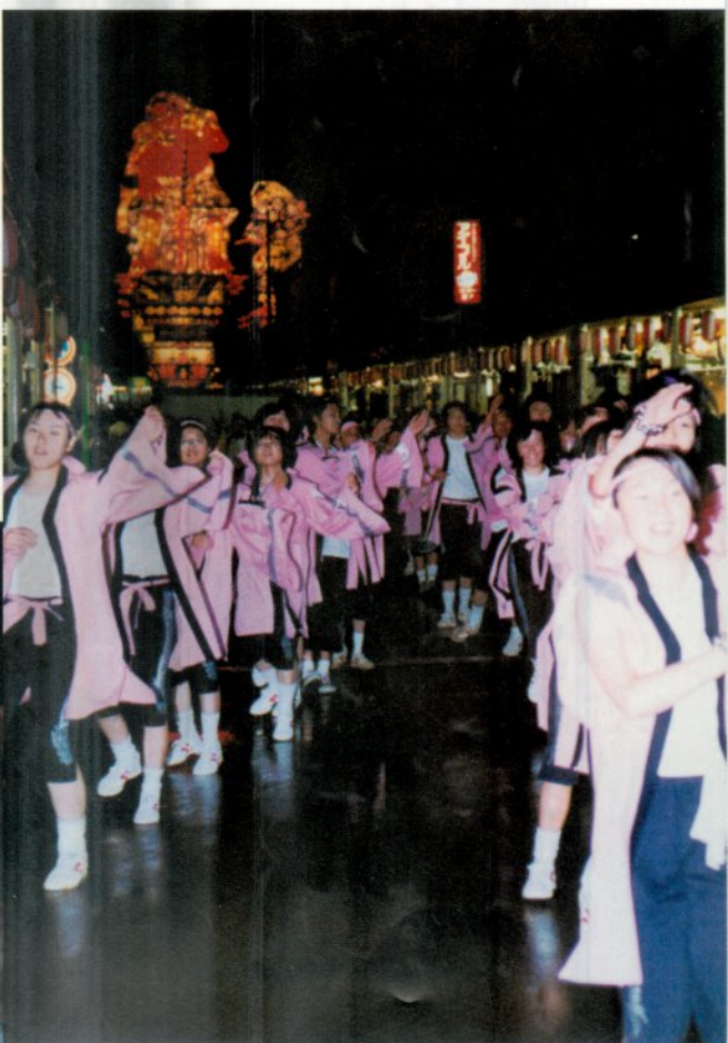
おそろいのピンクのハンテンで踊る 高校生立佞武多応援隊の皆さん