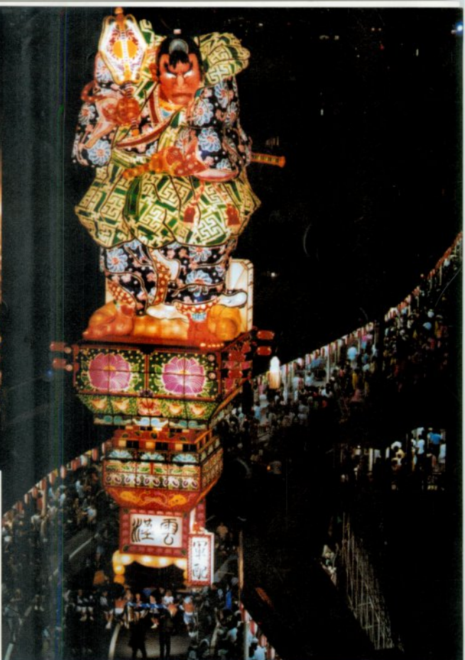
本年初お目見え「軍配」 高さ22.20m 重さ16tの立佞武多が ゆっくりゆっくり運行