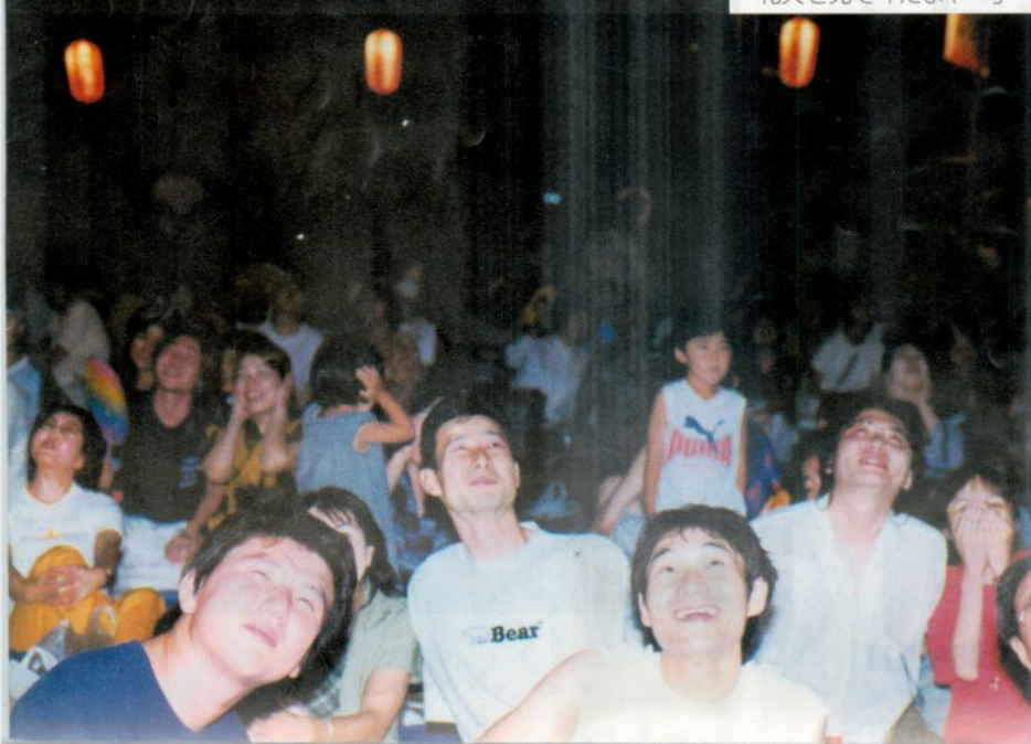
花火を見て「たまや〜」