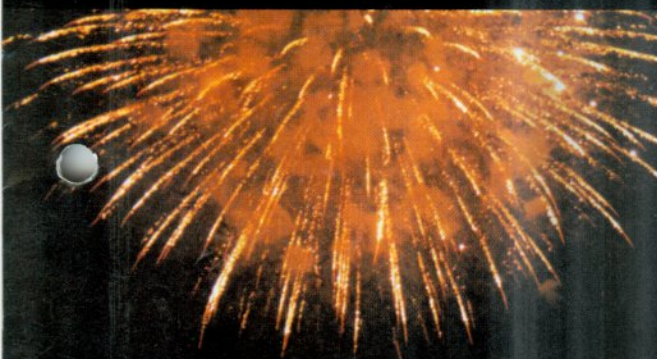
みごとなナイアガラの滝