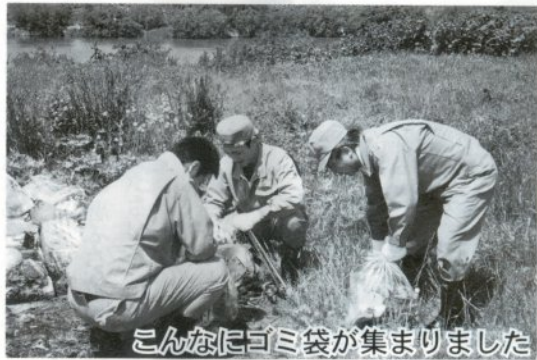
こんなにゴミ袋が集まりました

五月三十日、岩木川河川敷・北斗グラウンドにおいて東北電力五所川原営業所の電気教室の修了生や電力グループの社員らによる清掃活動が行われました。これは、五月三十日の「ごみゼロの日」にちなんで毎年行われているもので、今年も同営業所の関連企業にも参加を呼び掛け、大々的にクリーン作戦を展開、総勢百八名でこれから同グラウンドを会場にして行われる火まつりや虫おくりに向けていよいよと空き缶などを一つ一つ丁寧に拾い、集まった二百五十のごみ袋に参加者は驚いていました。