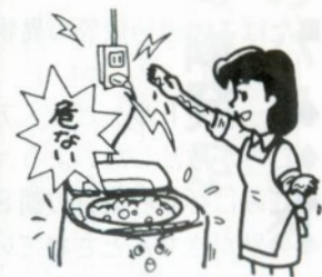
ぬれ手でプラグはやめよう (財)東北電気保安協会