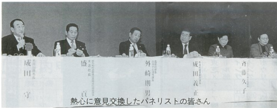
熱心に意見交換したパネリストの皆さん

本県の道路整備を計画的、重点的に進めるためのシンポジウム、二〇〇〇「青森の道づくり」が青