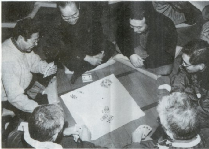
「座布団を囲んで車座になった参加者は、深い読みと駆け引きの心理戦を展開していました」