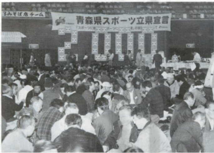
「参加者で埋め尽くされた会場は、随所で笑い声や悔しがらる声があきわき起こっていました」