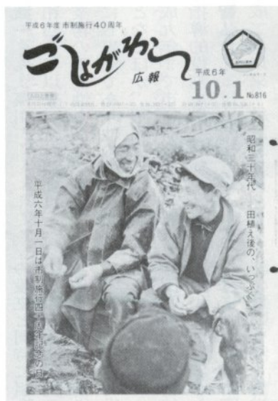
「平成6年10月1日に発行された40周年記念号。写真で40年前の五所川原を紹介していました。また、サイズはB5判ながらも現在の形式となっています」