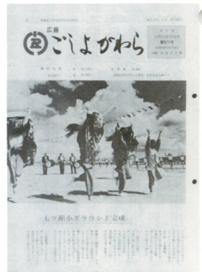
「昭和59年10月15日に発行された30周年記念号。30周年式典、七ツ館小学校グラウンド完成の記事が掲載されました」

市広報はこれまでもこれからも皆さんに市政を伝え続けます 昭和二十九年十月一日の市制施行より四十五年。その間、広報は時代の変化とともに名称、形式を変化させながらも、当市の出来事を皆様に伝えてまいりました。今振り返れば広報には皆様の思い出がたくさん詰まっています。 そして、これからも「広報ごよがわら」は市政を、イベントを、生活を皆様にお知らせし、五所川原の歴史を綴ってまいります。