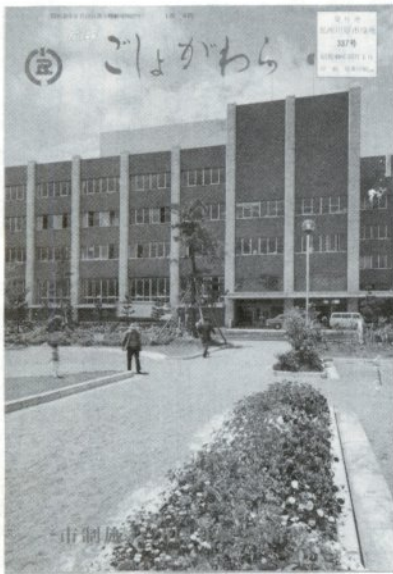
「昭和49年10月1日に発行された20周年記念号。特集号として表紙はカラーとし、内容も市制20年の歩みを年表つきで紹介していました」