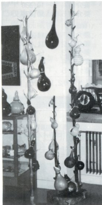
「くるみ園に寄贈された 見事なヒョウタンと飾り台」

主 催 / ごしょがわら菊まつり実行委員会 問い合わせ先 / 商工観光課 内線392