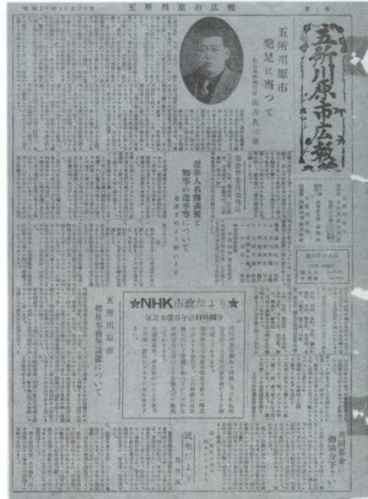
「記念すべき広報第1号は昭和29年10月20日A3判で発行されました。当時の人口36,504人、世帯数6,295戸のほか市制施行にともない市議会議員の構成、市役所の機構などが掲載されています」