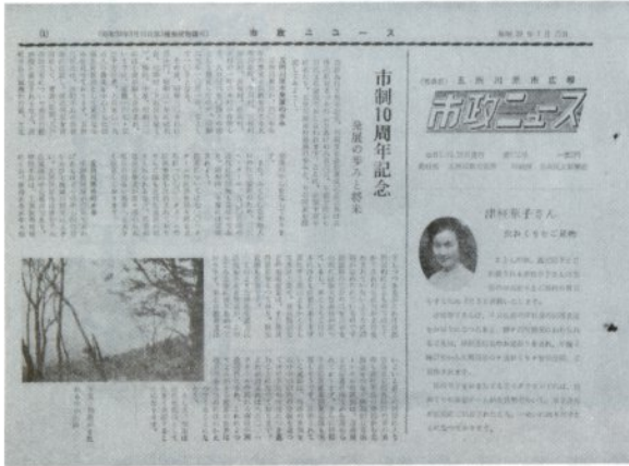
「昭和39年7月25日に発行された10周年記念号。この当時は毎月5・15・25日の3回、広報が発行されていました」

9月30日現在 ( ) 内は前回比、男24,029(-16) 女26,792(+2) 計50,821(-14) 世帯18,204(-4)