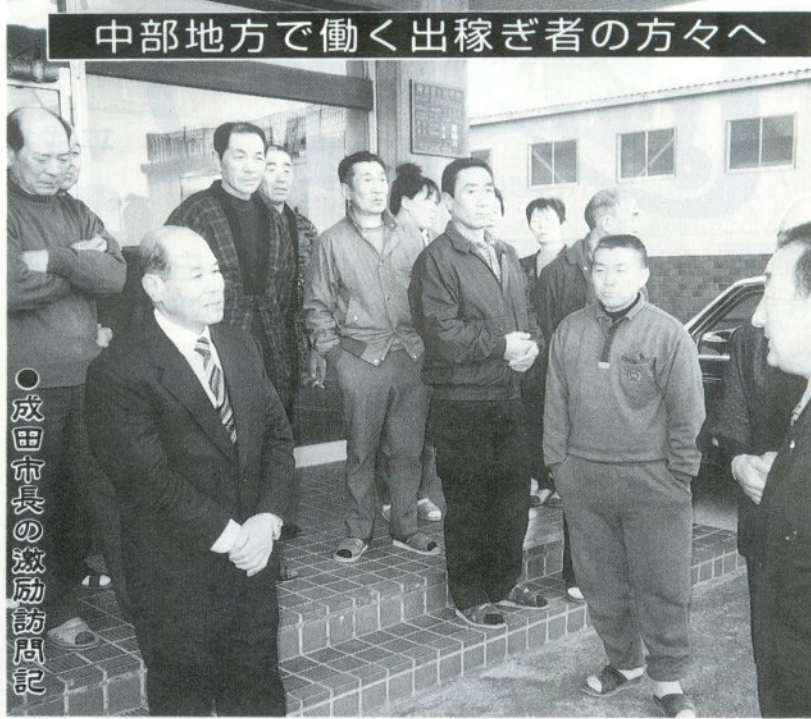
成田市長の激励訪問記

二月二十一日から二十三日の三日間、県外で働く出稼ぎの方々が安全で明るい出稼ぎをされているか職場環境を確かめ、健康に気をつけて働かれるよう激励するため、成田市長が中部地方の事業所四カ所を訪問しました。今回は、その様子を市職員員の行動記録でご紹介します。