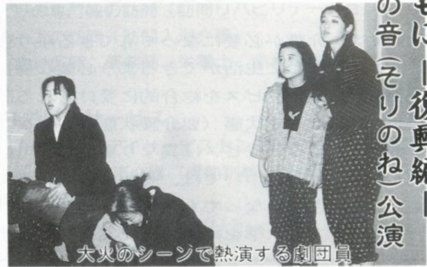
大火のシーンで熱演する劇団員

事業として「不撓不屈編」が、昨年二月に「文化編」がそれぞれオルテンシアで、また今年二月には青森文化ホールで「総集編」を公演し市内外から高い評価を受けています。三部作の完結編となる今回はたが重なる水害にいとみ、昭和初期の二度にわたる大火を乗り越え、そして市制施行三周年記念事業の平和産業博覧会までの苦難と繁栄の歴史を緊迫感あふれる、そして時にはコミカルな演技で団員達が熱演し、会場を埋めた約八百人の観衆からは盛んな拍手と歓声が沸き起こっていました。