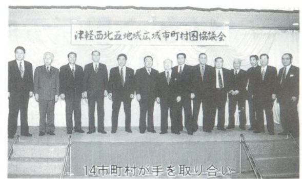
14市町村が手を取り合い

西北五地方(板柳町を除く)十四市町村で組織する「津軽西北五広域市町村協議会」が三月四日、青陽園で開かれ、出席した十四首長により同協議会の廃止届出書と「つがる西北五広域連合」の設立申請書に調印が行われました。 同日、申請書と関係市町村各議会の議決書を添えて県に提出し、同連合は、県の設置許可証が交付される二十五日に発足する予定です。広域連合は、行政の効率化や地方分権に対応する受け皿になる特別地方公共団体で、発足すれば「津軽広域連合」に次いで県内で二番目となります。