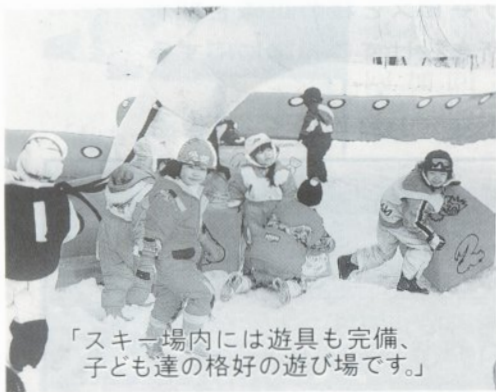
「スキー場内には遊具も完備、子ども達の格好の遊び場です。」

グリーンバイオ村の「ファミリースキー場」は、料金が無料で初心者、家族連れも楽しめるレクリエーションの場です。