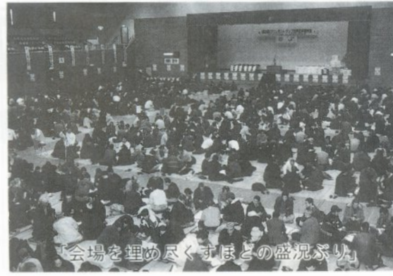
「会場を埋め尽くすほどの盛況ぶり」

五所川原で昔から親しまれてきたゴニンカンを通じて、地域おこしをしようと平成七年から開催されている同大会は、開催することに参加者が増しており、今回は県内在住者の外国人も多数参加し、九百人(六人チーム)が四回戦つ