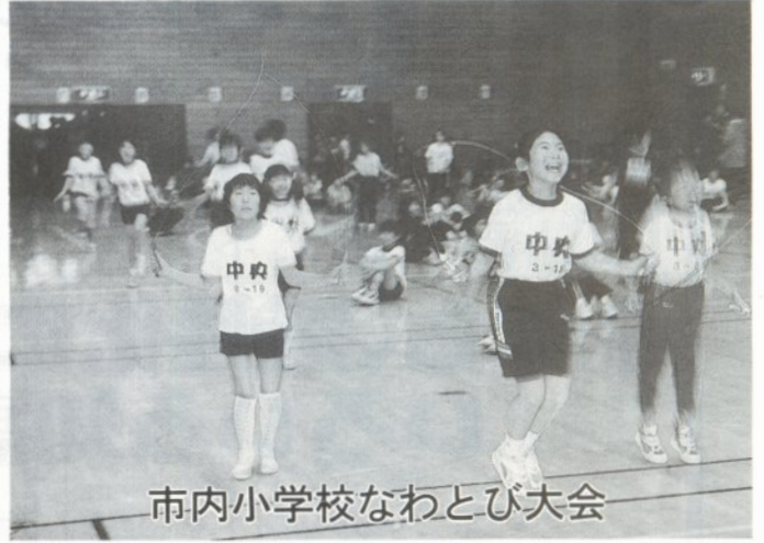
市内小学校なわとび大会

12月23日、中心商店街の各所にイルミネーションが取り付けられました。大町旧ロータリーで行われた点灯式では、五所川原幼稚園児らが歌などで冬の街の雰囲気盛り上げ見守っていた市民を幻想の世界に誘っていました。