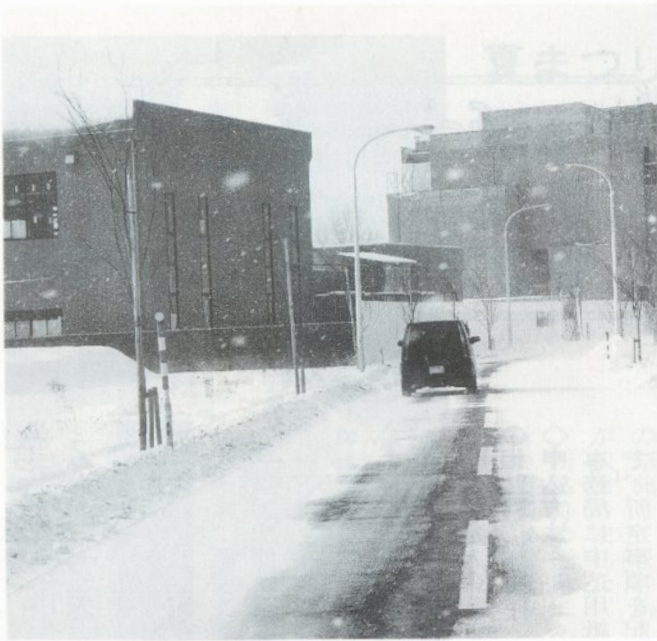
エルムの街に建設中の勤労者スポーツセンター(左)と国の合同庁舎(右)