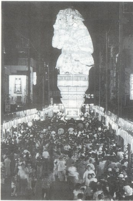
「昨年以上の盛り上がりが見られ、今年も暑い夏を！」

これまで長年にわたり奥津輕を代表する祭りとして、市内は勿論、西北五地域に親しまれてきた「五所川原虫おくりと火まつり」の名称が今年から変わります。