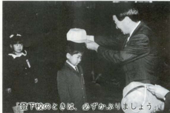
「登下校のときは、必ずかぶりましょう」

四月七日には、黄色安全帽贈呈式が栄小学校で行われました。これは市内小学校に入学した新一年生、五百十五名に対して黄色安全帽と反射材が市から、黄色いワッペンが株式会社富士銀行、安田火災海上保険株式会社、安田生命保険相互会社、安田信託銀行株式会社から贈られたのに際して行われたものです。