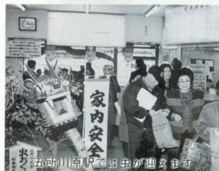
五所川原駅では虫が迎えます