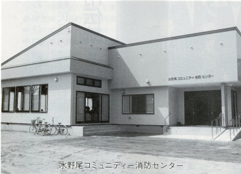
水野尾コミュニティ消防センター