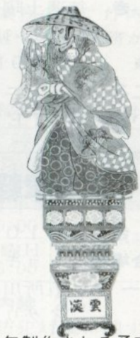
今年製作される予定の立佞武多

の皆様の参加をお願いしたいと思っております。 あなたの力で、立佞武多を東京ドームに出陣させ、熱い感動を一緒に体感しましょう。