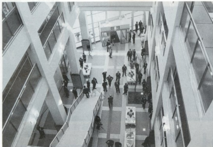
玄関に入ると吹き抜けがあり広い空間を作っています