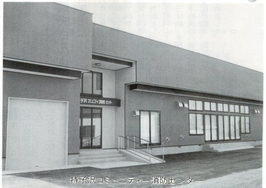
持子沢コミュニティ消防センター

水野尾・持子沢両集会所の老朽化、地域の住民からの厚い要望に応えた水野尾・持子沢両コミュニティ消防センターがこの四月に完成しました。 両センターは、地域住民の方々のコミュニケーションを広げる場として、また防災拠点として大いに活用されることになっております。 四月五日に行われた水野尾コミュニティ消防センター落成式では、成田市長から「皆様の努力と熱意がセンター完成という実を結びました。衆議の場として地域みんなの信頼が増幅していく、そんな場としてください」と挨拶を述べ、完成を祝いました。 また、持子沢コミュニティ消防センターの落成式は四月十九日、同所にて催されます。