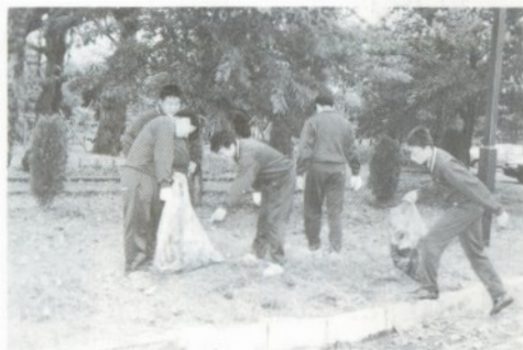
ごみを集める五工高生徒たち

十月九日、五所川原工業高等学校（小笠原繁敏校長）の全校生徒八百四十人が、北斗グラウンド、菊ヶ丘水郷公園などの清掃奉仕を行いました。これは、校内外での奉仕活動を体験することにより地域社会の一員としての自覚を高めるために毎年行っているものです。当日は、小雨でしたが生徒らは、各班に別れてごみ袋とデレキを手に空き缶や紙くずなどのごみを拾い集めていました。学校では、生徒にこの活動の感想文を提出させてボランティアの意識を高めることにしています。