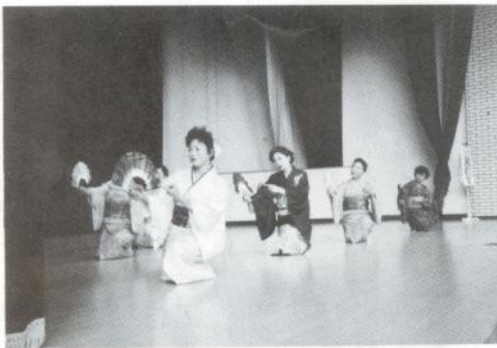
盛況であった発表会(日舞教室のみなさん)

また、多くの市民が訪れその出来ばえに目を見はりながら来年は是非とも教室に参加したいとの声が多く寄せられました。