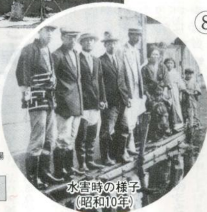
水害時の様子 (昭和10年)