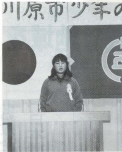
少年の主張発表会

「第十一回少年の主張発表大会」が十一月二十七日、働く婦人の家で開かれ、予備審査をパスした市内の小・中学生十人が発表しました。同大会は、子供たちが家庭、学校、地域社会のなかで触れ合いを通して日ごろ考えていることを発表し、地域住民がより少年の健全育成に関心を高めてもらうのが目的で開催しているものです。