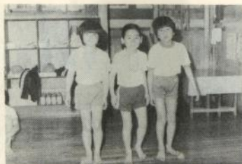
青竹踏みをする子ども達

を追求していたところ、足の裏にある「土踏まず」に深い関係があるのではと考え、全校児童の足型調査を行いました。