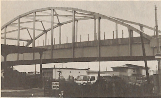
五所川原の大動脈となる立体交差橋