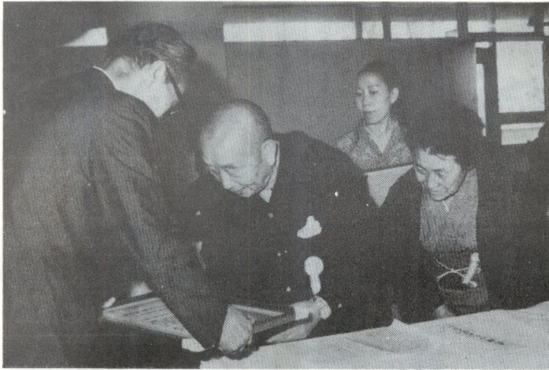
飯塚助役から顕彰状を受けるおとしよりのたち

市主催のとしの長寿夫婦顕彰式は、さる九月三日市民文化会館に七十七組み百五十四人のおとしよりを招待して行なわれました。ことし顕彰式に招かれたのは、結婚して五十年以上の夫婦のいづれかが七十七