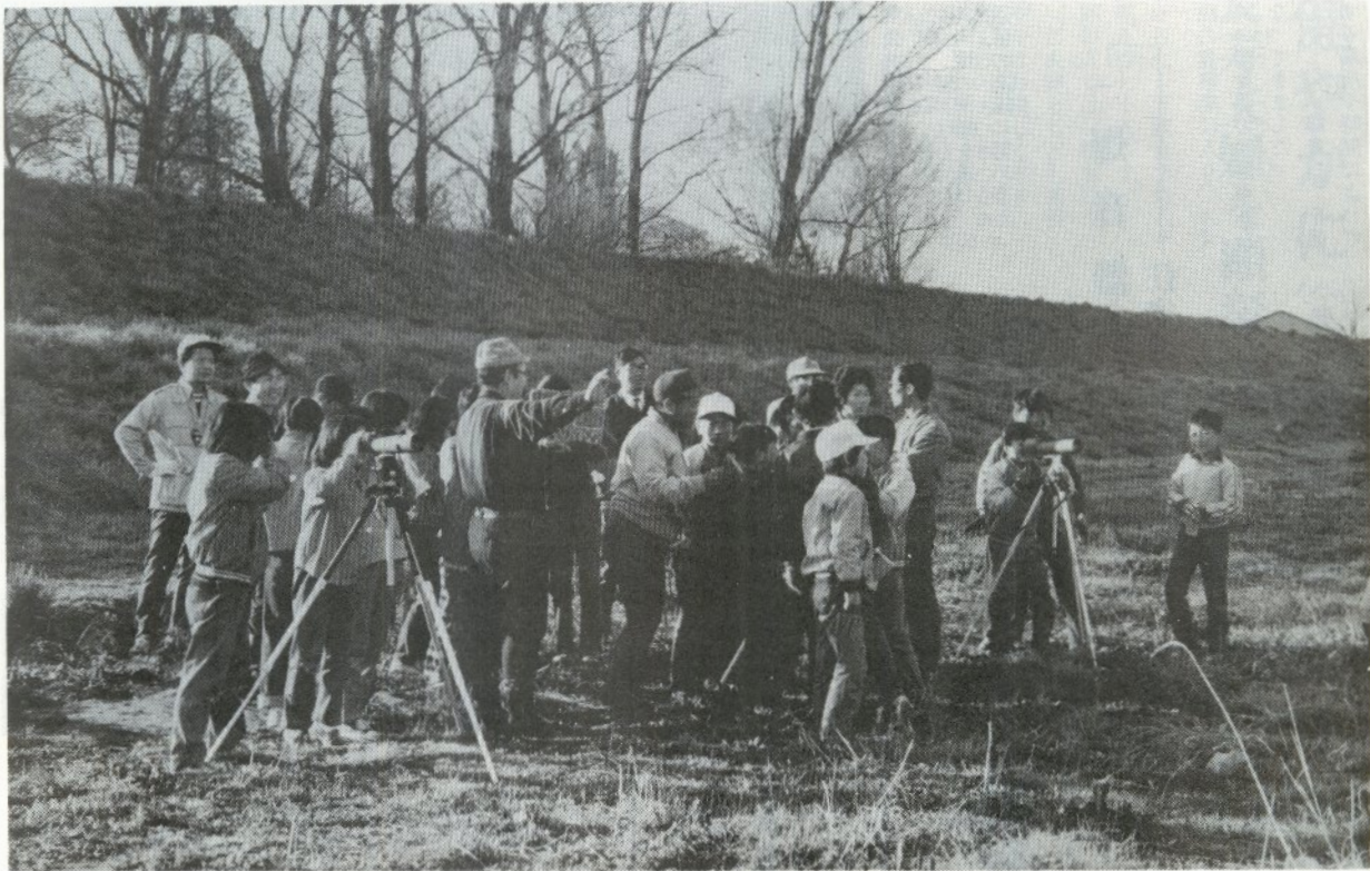
野鳥の観察会 (元町八幡宮に集合、毎月1回岩木川原一帯で行なわれています)

市の人口 男 25,143人 世帯数 13,888 52,044人 女 26,901人 (昭和51年9月1日現在) 住民基本台帳から