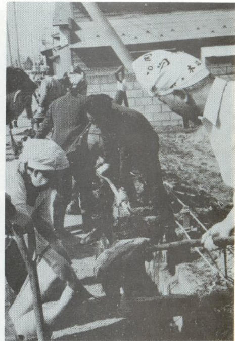
春の清掃運動(下平井町)で

九月二十一日～二十七日までの一週間は、環境衛生週間です。 この週間は、すべての国民が清潔で快適な生活を営むため日常生活や事業活動に伴って生じるゴミを生活環境が汚染しないよう、迅速かつ適切に処理するとともに食中毒や伝染病を媒介するおそれのあるねずみ、ハエ、カなどの駆除を効果