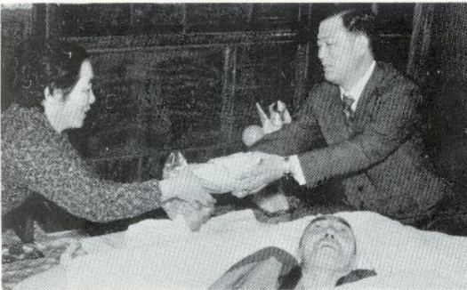
「児童、生徒の皆さんにも…」と赤平農業センター所長(右)