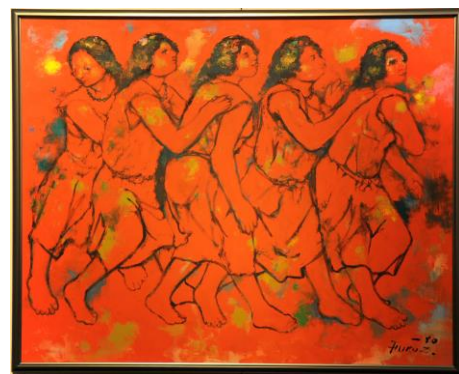
「巫女の踊り(魏志倭人伝)」 福沢一郎