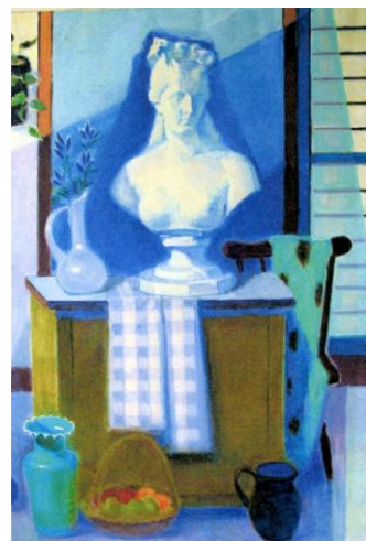
「アトリエの一隅」 伊藤正規