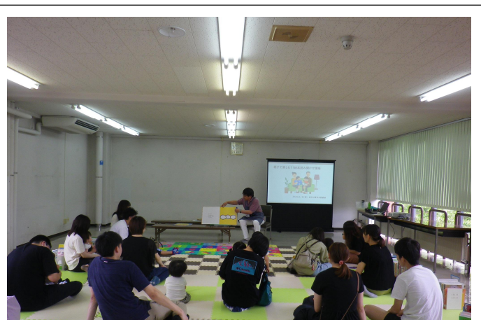
講師がまず読み聞かせを行い、参加者が見学