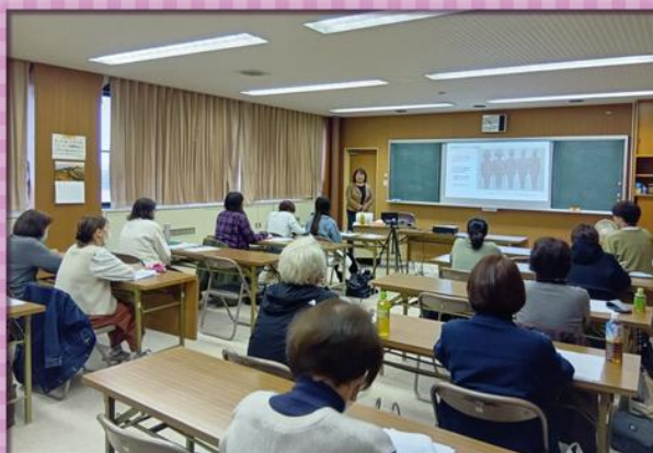
・提供会員養成講座・