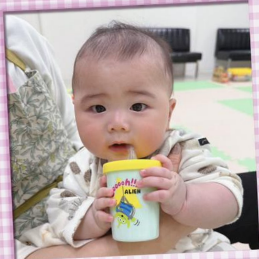
・すてっぷ広場での託児・