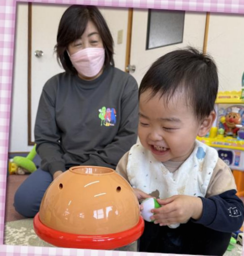
・子育てステーションでの託児・