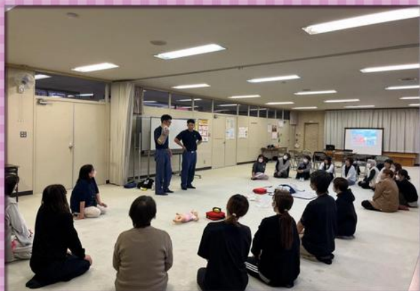
・普通救命講習Ⅲ・